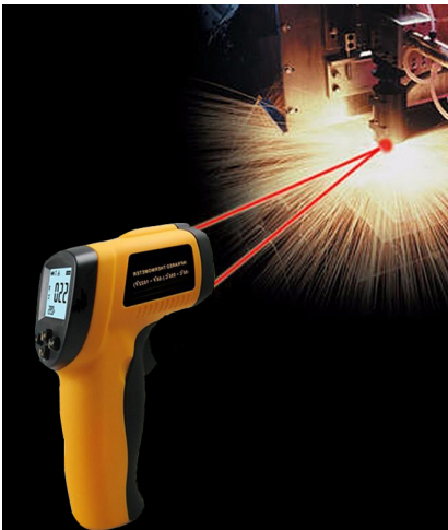
อัตราส่วนระหว่างระยะการวัดและขนาดของวัตถุ